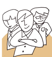
セキュリティ競技経験者 中学・高校生 (予定)